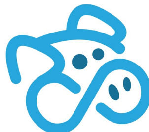
「データの貯金箱」ロゴ