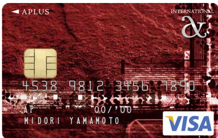
アプラスカード シティ・レッド JCB・Visa・MasterCard